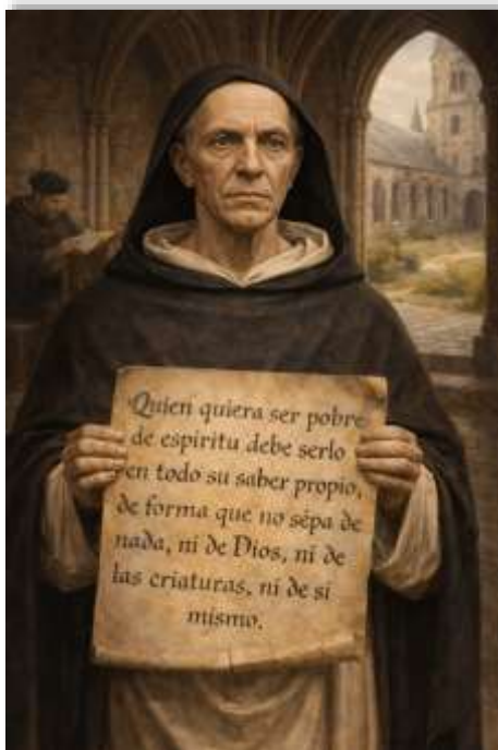
Ilustración 1 Imagen de Maestro Eckhart recreada por IA (ChatGPT, 2026) en base a una estatua reconocida en Colonia

Las sospechas sobre la ortodoxia de Eckhart comenzaron a hacerse escuchar hacia 1325. Nicolás de Estrasburgo, nombrado Visitador Pontificio de la Orden dominica en Teutonia, inició internamente una investigación sobre Eckhart con la intención de protegerle —al tratarse de un dominico, prefería que el caso quedara en manos de la Orden y no del arzobispo—, y el resultado fue una declaración de inocencia. Pero Enrique de Virneburg, que no aceptó ese veredicto, promovió su propio proceso en 1326 a partir de una denuncia presentada por dos frailes dominicos —Hermann de Summo y Guillermo de Nidecke—, quienes elaboraron listas de proposiciones supuestamente heréticas extraídas de las obras de Eckhart. La primera comisión